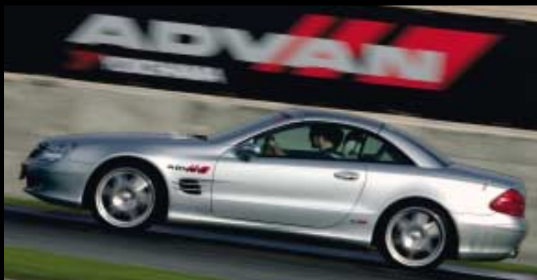
Présentation presse à Dubaï de la gamme ADVAN - V103 sur BRABUS SL 350