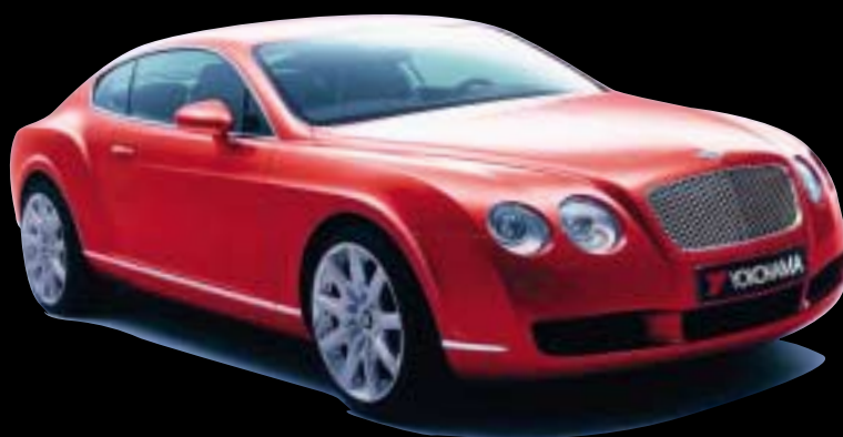
V103 en équipement d'origine 20" sur Bentley Continental GT

Par exemple, le 275/35 ZR 20 est homologué en exclusivité par Bentley sur la Continental GT,